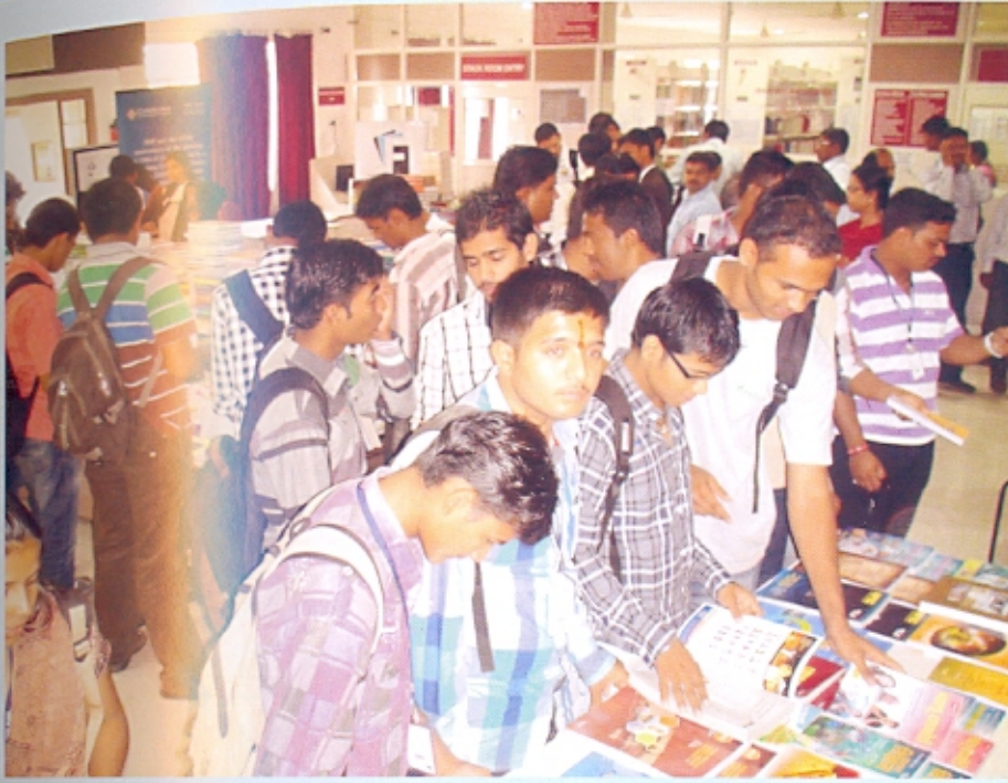
ग्रंथालयातर्फे आयोजित केलेले ग्रंथप्रदर्शन