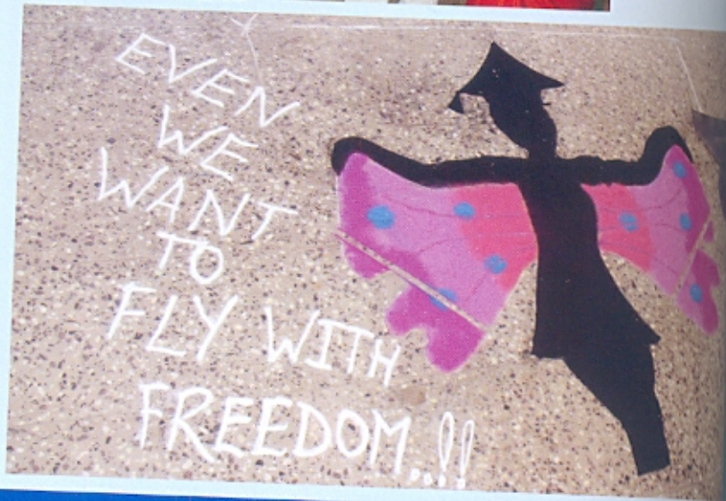
युवासमाह - पारितोषिकप्राप्त रांगोळी