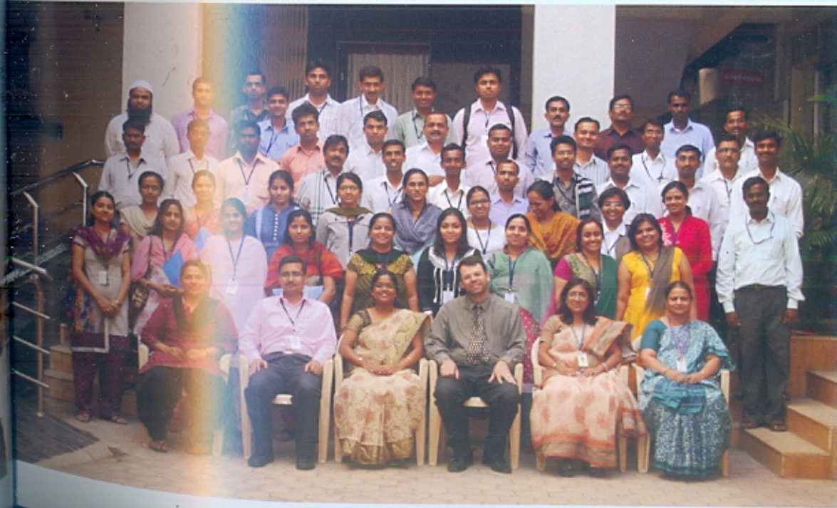
ग्रंथालयातर्फे आयोजित आंतरराष्ट्रीय कार्यशाळेत सहभागी झालेले प्रतिनिधी