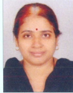
प्रेरणा सुरु मलेशिया येथील आंतरराष्ट्रीय चर्चासत्रात शोधनिबंध वाचन