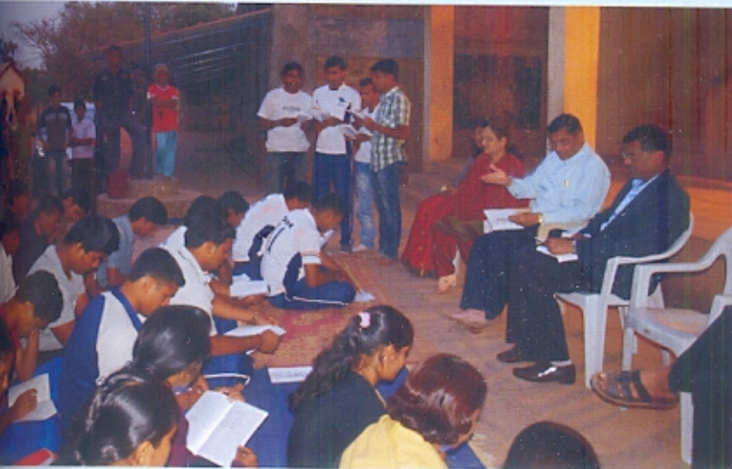
राष्ट्रीय योजना- हिवाळी शिबिर - गराडे, ता. पुरंदर.