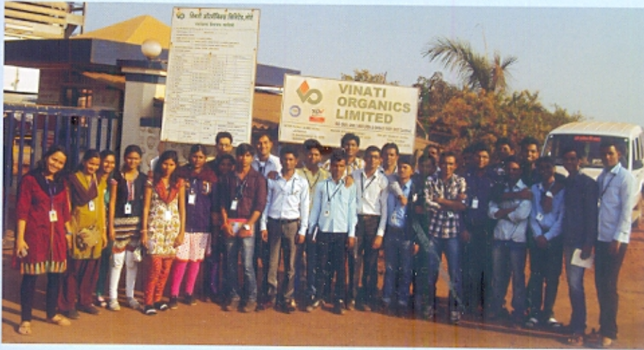
रसायनशास्त्र दळ्युतर विभागाची शैक्षणिक सहल