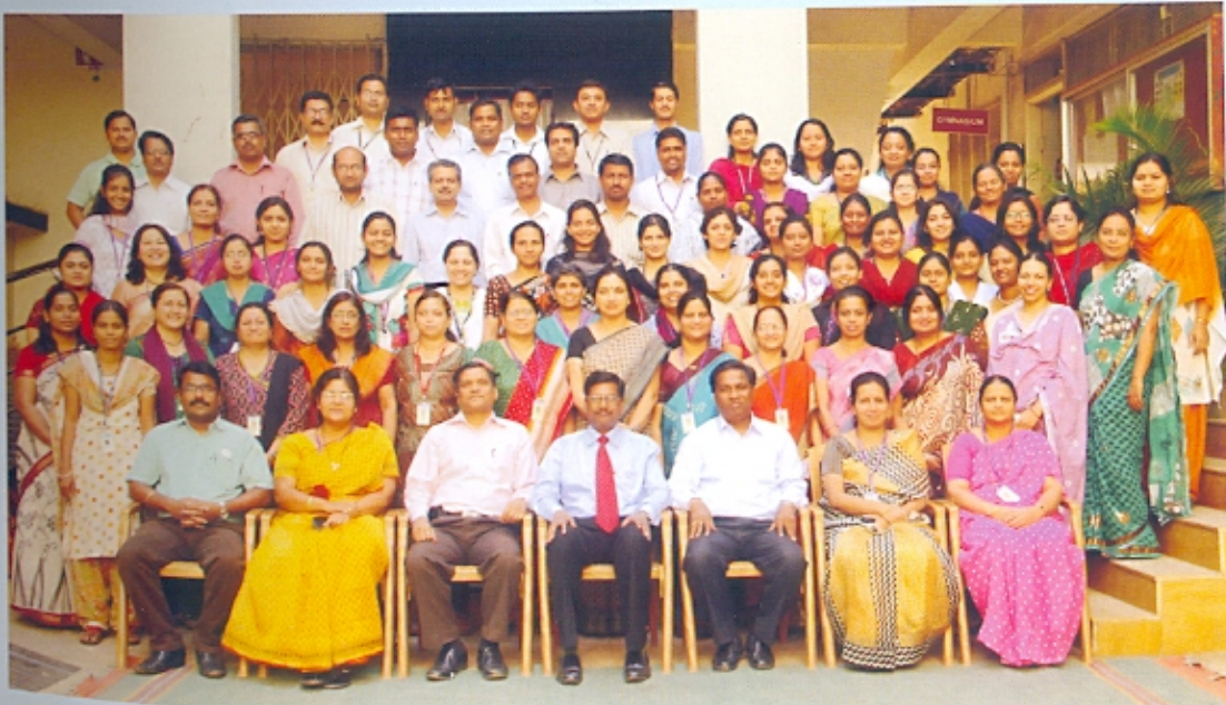
महाविद्यालयातील प्राध्यापक वर्ग