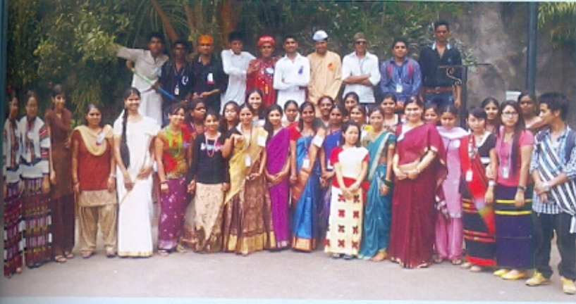
वाणिज्य विभागातर्फे सादर करण्यात आलेल्या 'ब्रिगॅन्ड बॉर्डर्स' कार्यक्रमात सहभागी झालेले विद्यार्थी