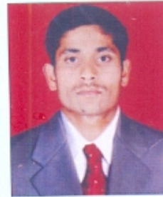
Madhav Made T.Y. B.A. (Hockey)