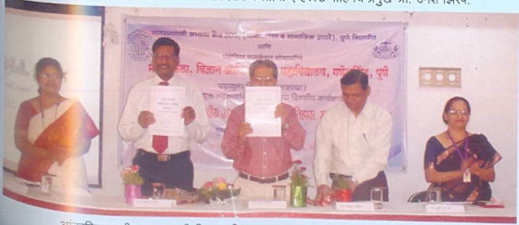
आंतरविद्याशाखीय अभ्यासाची दिशा-इतिहास, समाजशास्त्र आणि अर्थशास्त्र विभागातर्फे आयोजित (मदव्युत्तर विभागासाठी) एक दिवसीय कार्यशाळा.